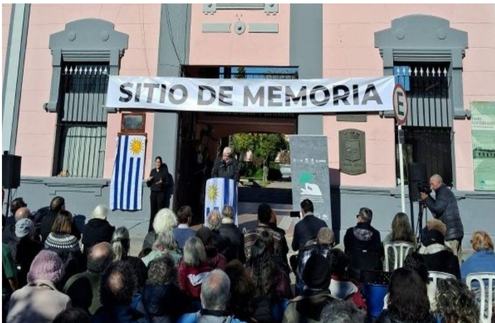
Sitio de la Memoria en el Paseo de San Fernando. Imagen tomada de FM Gente

El Sitio de la Memoria se ubica en el Paseo de San Fernando, lugar donde durante la dictadura funcionó un centro clandestino de detención y torturas.