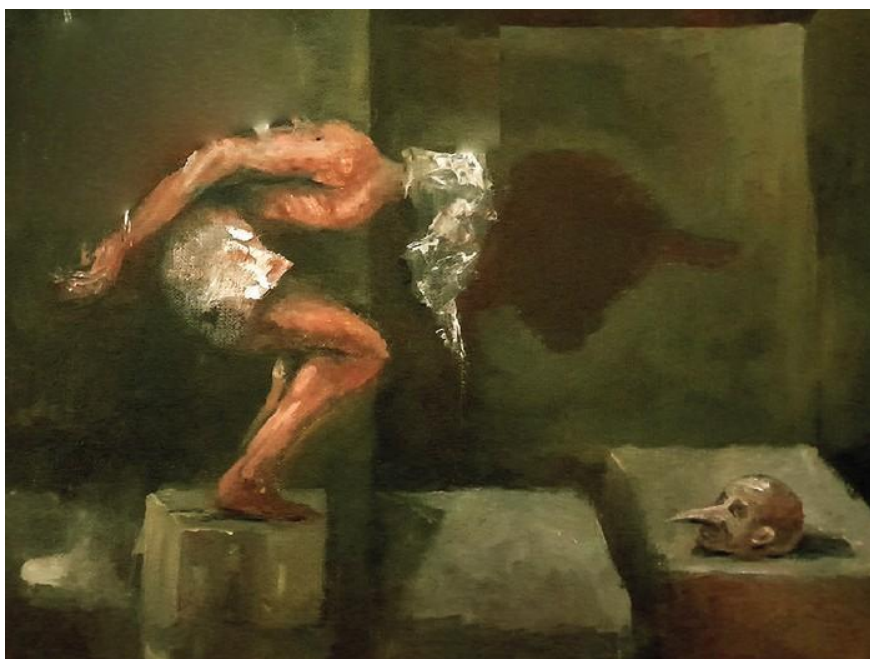
Ilustración: Ramiro Alonso

Uruguay, un país de menos de tres millones y medio de habitantes (y bajando), tiene hoy cerca de 17.000 personas privadas de libertad (y subiendo), según datos del Instituto Nacional de Rehabilitación: una de las tasas más altas del mundo. El excomisionado parlamentario penitenciario habló de un estado de cosas inconstitucional y de condiciones que el sistema interamericano calificaría sin esfuerzo de crueles, inhumanas y degradantes. En ese país, en este momento, una parte del Frente Amplio discute reflotar un proyecto para mandar gente a la cárcel por sus dichos.