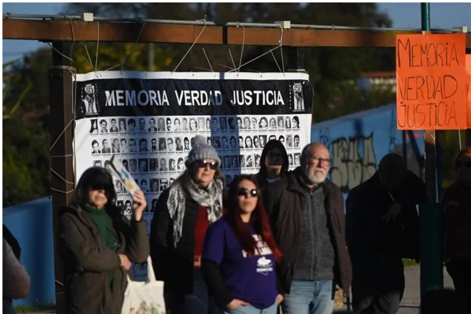
Acto de Memoria, a 53 años de la Huelga General, el 27 de junio, en Parque del Plata.

El Frente Amplio, el Partido Nacional y el Partido Colorado, al igual que el PIT-CNT, también se pronunciaron sobre el quiebre institucional del 27 de junio de 1973.