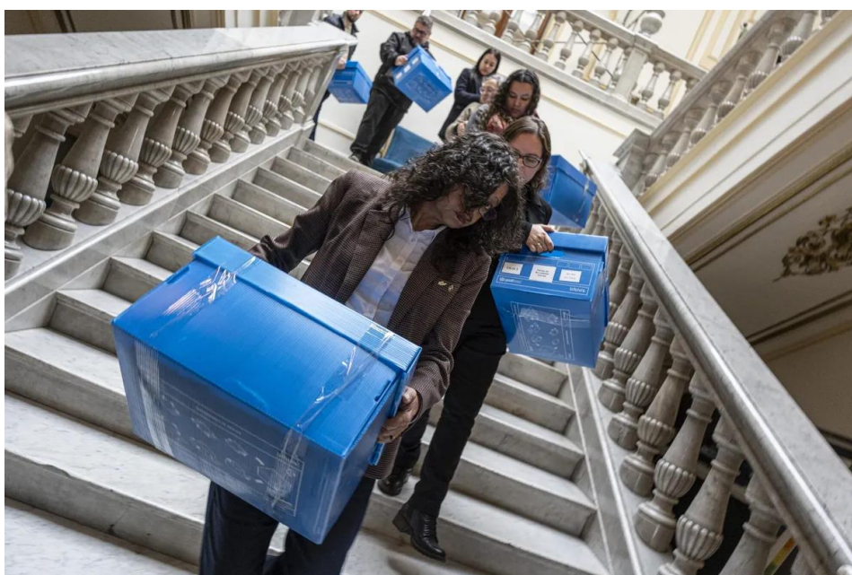
Entrega de documentos en el Ministerio del Interior, el 28 de mayo.